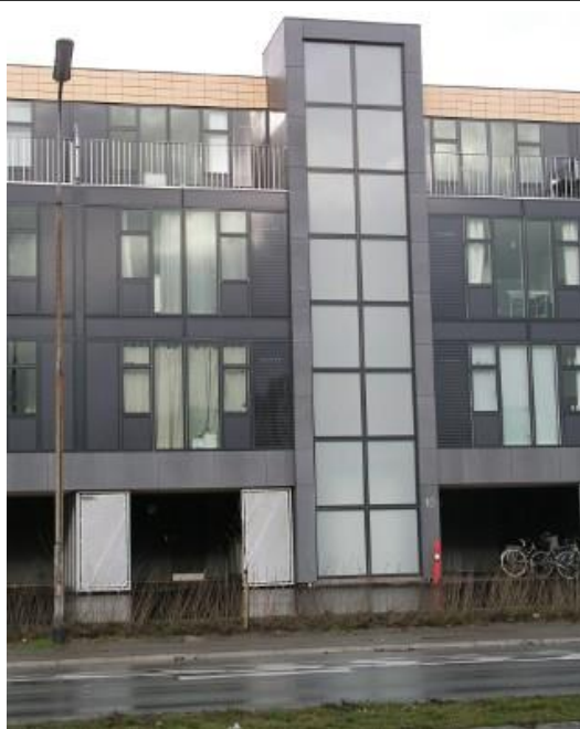
Ungdomsboligerne på Ryhavevej 1 måned efter indflytningen.

det helt anderledes ud. Her er konkrete eksempler på nyere bygninger i Hasle.