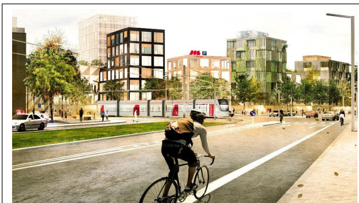
Ifølge "Aarhus Letbane" vil Hasle Torv efter deres skøn få dette udseende.

Af forskellige årsager ønsker Kommunen byfortætning i hele Aarhus, og hermed også i Hasle. Fra forskellig side er der kommet bud på denne byfortætning. Et par af disse er vist nedenstående. Da nedenstående to figurer blev vist på Hasle Fællesråds borgermøde den 31.01 2017, vakte de en voldsom modstand blandt deltagerne. Gå derfor ud fra, at disse planer om byfortætning bestemt ikke er i overensstemmelse med borgernes ønsker.