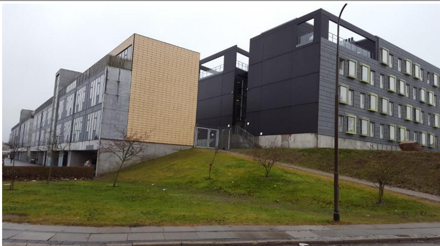
Bispehaven fortættes med nye ungdomsboliger på Ryhavevej og Bispehavevej.