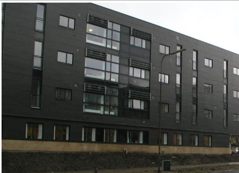
Det er, hvad Hasle tilbyder sine ældre medborgere, som ikke længere kan så meget selv.